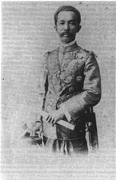
Putera Damrong-rajanubhab, Senabodi Mahatthai Tahun 1892 hingga tahun 1915