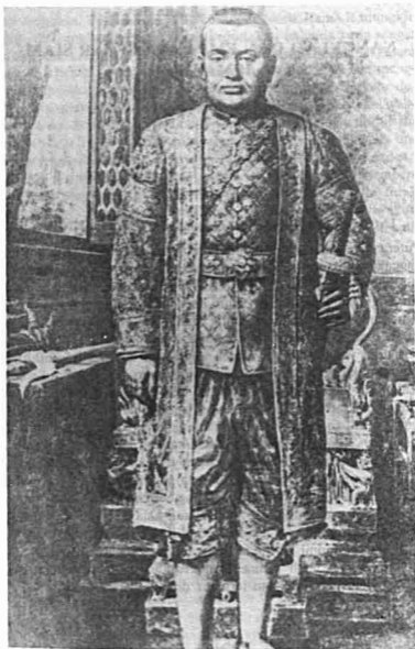
Rama III (1824–1851)