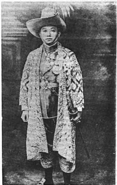
Raja Vajiravudh (Rama VI) (1910-1925)