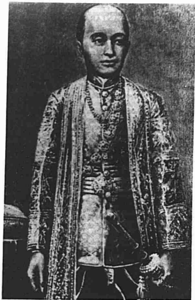
Rama II (1809-1824)