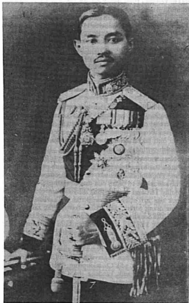
Raja Prajadhipok (Pokklao) (1925-1935)