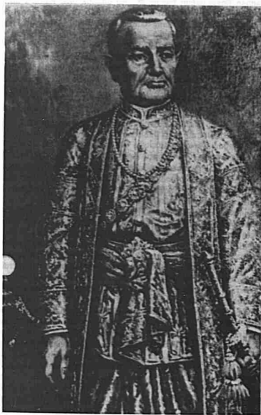
Rama I, Pengasas Dinasti Chakri (1782-1809)