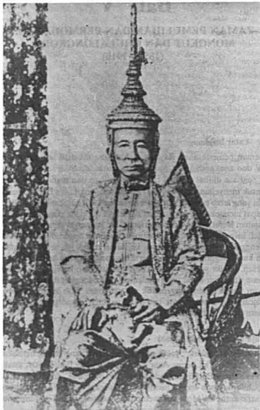
Raja Mongkut (1851-1868)