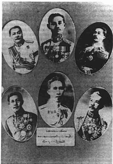
Prajadhipok dan Ahli Majlis Tertinggi Negara