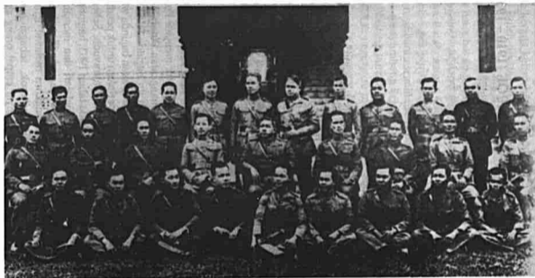
Pemimpin-pemimpin Khana Rat yang berjaya menggulingkan sistem kerajaan mutlak Dinasti Chakri