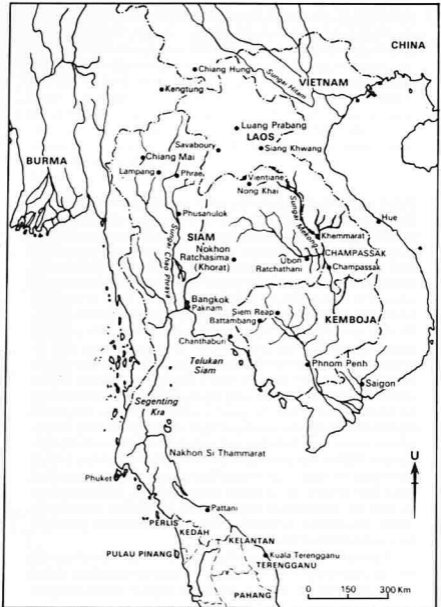
Negeri Thai Semasa Perang Dunai II (1939-1945)